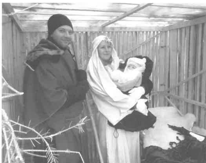
Živé jesličky