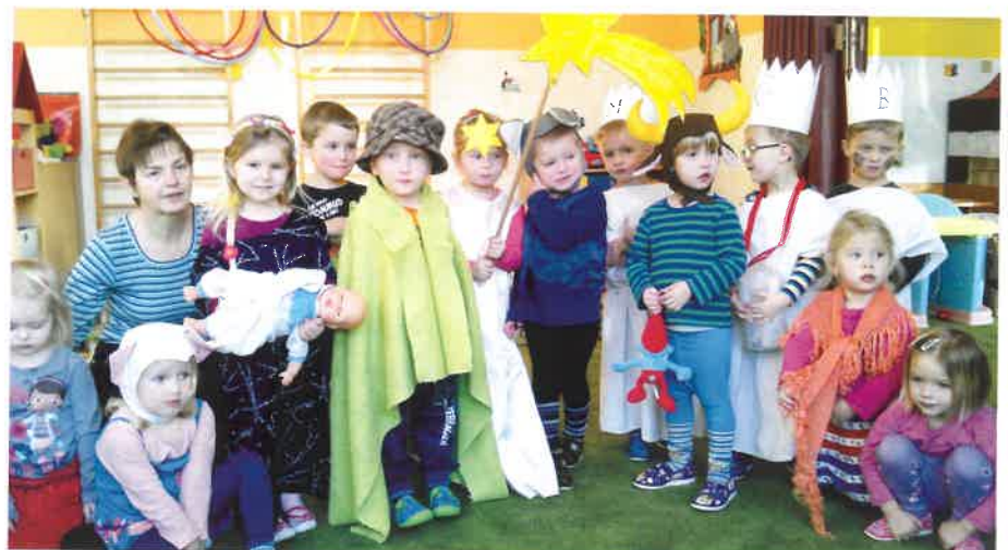
Živý betlém, třída Broučků MŠ Sobotka