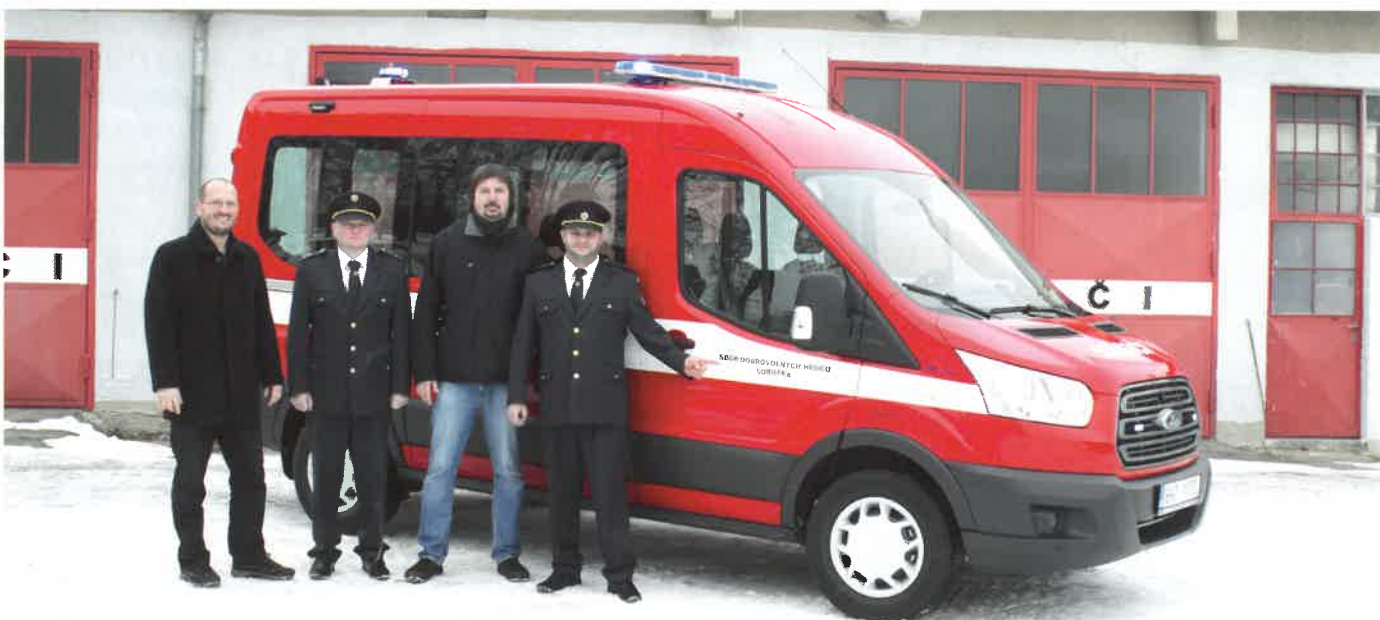
Nové hasičské auto – foto: Z. Krámek

Zpravodaj Šrámkovy Sobotky – vydává MĚSTSKÉ KULTURNÍ STŘEDISKO SOBOTKA, nám. Míru 3, 507 43 Sobotka tel.: 493 571 618; e-mail: mks@sobotka.cz, www.sobotka.cz. Odpovědná redaktorka: Pavlína Havlová, redakční rada: Karol Bílek, Jan Janatka, Zbyněk Krámek, Marie Sekerová, Magdaléna Šrůtová, Radka Vokounová. Grafická úprava a tisk: MS Polygrafie s. r. o., Horka 35, 294 01 Bakov nad Jizerou, www.mspolygrafie.cz. Uveřejněné příspěvky nemusí vyjadřovat názory redakční rady Zpravodaje. Za věcnou správnost odpovídají autoři příspěvků. ISSN 12 12 – 7906; MK ČR E 11563. Uzávěrka dalšího čísla 24. 3. 2017.