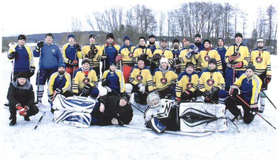
Společné foto hokejových týmů