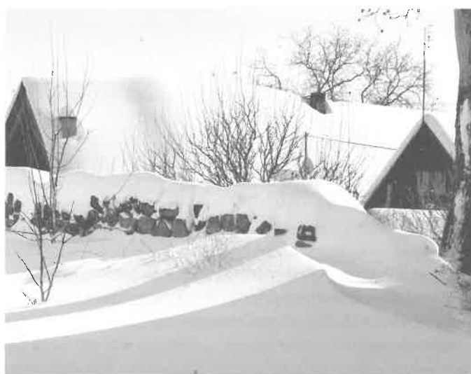
Zima v Sobotce