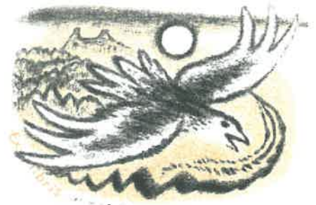
Ex libris jako PF r. 1989.