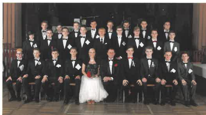
Podzimní taneční TaPŠ ILMA 2016 Sobotka a Dolní Bousov