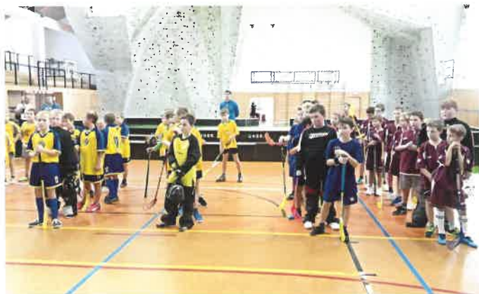
Okresní kolo ve florbalu – sobotečtí „Fráňové“ získali druhé místo.